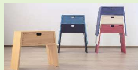
スタッキングスツール