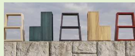
ステップスツール