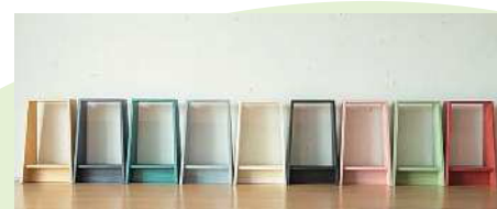
スタンドスツール