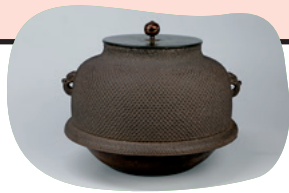
重要文化財「芦屋殿地真形釜 (あしやあられじしんなりがま)」