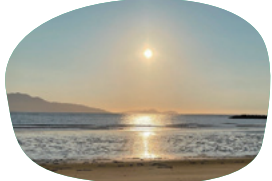
白い砂浜と遠浅な海が 広がる「芦屋海水浴場」