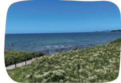
地層や海の生物を観察 できる「夏井ヶ浜」