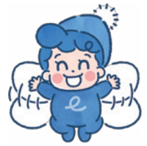
福岡カーボンプレジット倶楽部 マスコット「エコちゃん」

県では、 過去2年以内 に太陽光発電設備や蓄電池を設置した家庭や事業者を対象とした「福岡カーボンプレジット倶楽部」を開設しました。お手軽に環境保全に貢献でき、 参加特典 もあります。ぜひご参加ください!