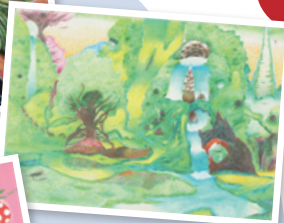
▲シャンティアの森 作:永田 圭祐