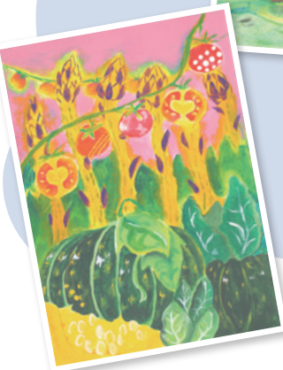
◀おやさい祭り 作:みなるん=テッサ・キノシタ