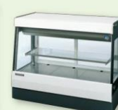
冷凍冷蔵用ショーケース など