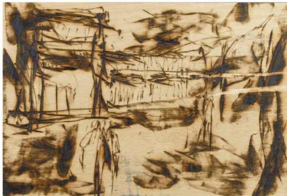
母里大徳 参考作品