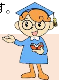
ヒューマン博士 （福岡県の人権啓発キャラクター）

主催/福岡県、(公財)福岡県人権啓発情報センター ■問い合わせ先/福岡県福祉労働部人権・同和対策局調整課 TEL:092-643-3325 FAX:092-643-3326 Email:chosei@pref.fukuoka.lg.jp