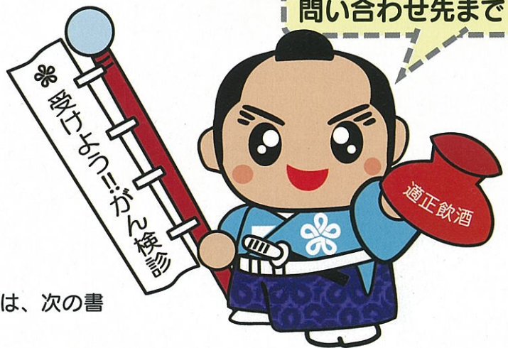
福岡県がん検診受診率向上 イメージキャラクター 「検診くん」

○利子補給対象者として県の資格審査で承認された場合は、毎年度、利子補給金の交付申請(※⑨、⑪)の手続きを行っていただき、内容審査のうえ、利子補給金の交付を決定します。