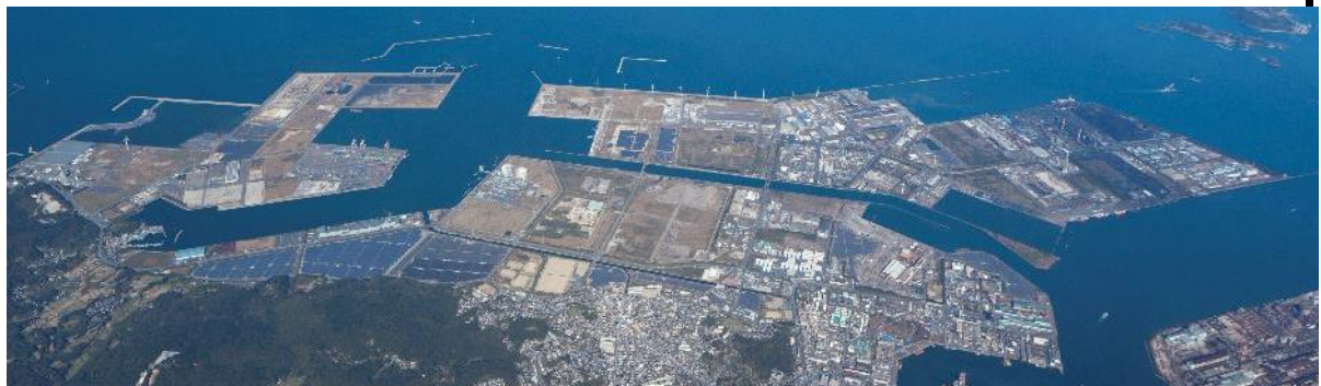
調査を行う北九州市響灘臨海エリア

このため、再生可能エネルギー由来等の国内製造と海外からの輸入のベストミックスによる水素等供給と、将来の拡張余地を十分に持った拠点整備が期待できます。