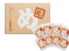
<福太郎・めんべい>