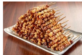
<とりかわ竹乃屋・とり皮>