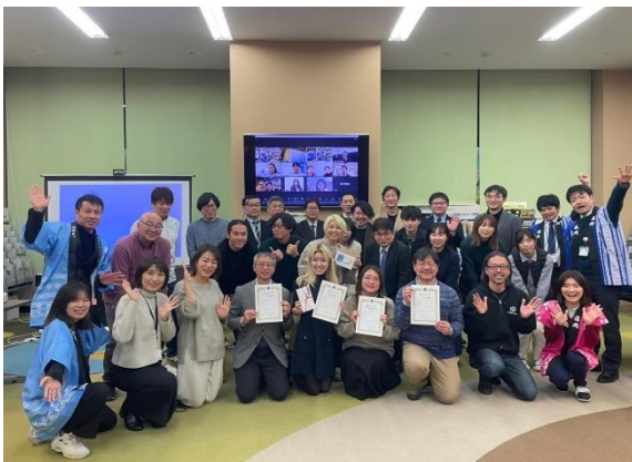
当日お集まりいただいた皆さん