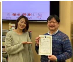
大正大学出版会 （小郡市）