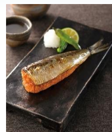
<中島商店・いわし明太子>