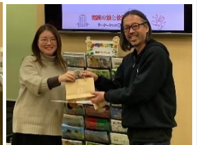
非営利型株式会社 Polaris （東峰村）

OMOYEL(株)のワーケーションプランは、柳川名物の鰻ランチや川下り、400年の歴史があるお屋敷の旅館「御花」での宿泊など充実した観光と市内ワークスペースでの仕事が融合したプラン。