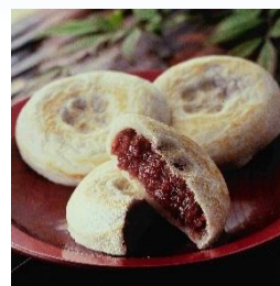
<かさの家・梅ヶ枝餅>