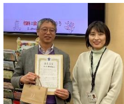
さいころ株式会社 （大木町）