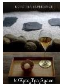
【ティーペアリング】

茶の香り、バランス、旨味など、来店者に茶の特徴を説明しながら提供し、茶と菓子のティーペアリングも行う。また、経営者と従業員は美味しい茶について研究しており、経営者は日本を訪問し、茶の知識を深めるとともに自ら美味しいと評価する日本茶を求め続けている。