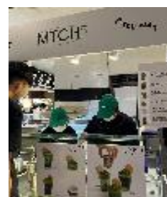
【大手百貨店内期間限定店舗 (八女抹茶の飲料・菓子販売)】

来店者は高品質な抹茶や抹茶の知識を求めるタイ人や日本人が多いが、「日本まで行かなくても高品質な抹茶を楽しむことができる」と東南アジア、欧米からの来店者も増えている。そのため経営者は福岡県や京都府を何度も訪問し、生産者や茶商と直接商談し、茶の知識を深めるとともに、茶を自ら選定している。