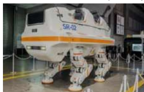
⑤ 福岡モビリティショー2023 出展予定 SR-02 (三精テクノロジーズ)