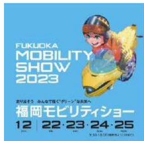
② 福岡モビリティショー2023 公式ビジュアル_02