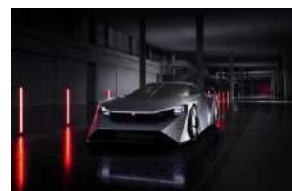
④ 「福岡モビリティショー2023」出展予定車両 Nissan Hyper Force (Nissan)