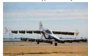
⑥ 福岡モビリティショー2023 出展予定 Mk-05 (teTra aviation corp.)