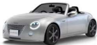
WP VISION COPEN