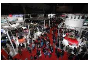
⑦ 福岡モーターショー2019の様子