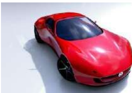
WP MAZDA ICONIC SP