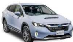
LEVORG LAYBACK Limited EX