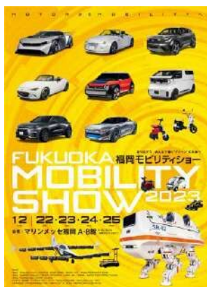
① 福岡モビリティショー2023 公式ビジュアル_01

「福岡モビリティショー2023」の告知・広報にご協力いただける場合、下記の画像をご用意しております。 お手数ですが下記申込み用紙にご記入の上、事務局宛にメールかFAXにて送信くださいますようお願いいたします。