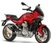
MOTO GUZZI V100 Mandello