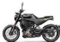
Husqvarna Svartpilen 401