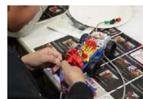
⑩ 福岡モーターショー2019の様子 (こども向け体験イベント)

※上記以外の「福岡モビリティショー」の出展車両は公式HPに公開しております。画像をご希望の方はご連絡ください。