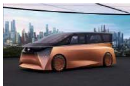
WP Nissan Hyper Tourer