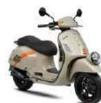
Vespa GTV 300