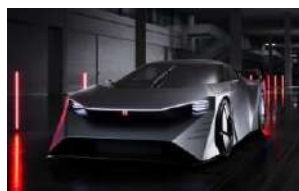
WP Nissan Hyper Force