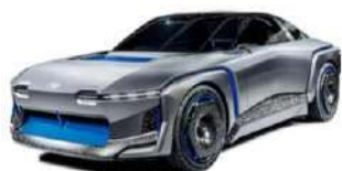
SUBARU WP SPORT MOBILITY Concept