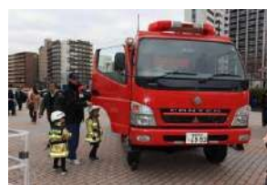
⑨ 福岡モーターショー2019の様子 (はたらくクルマ)