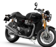
TRIUMPH Thruxton RS