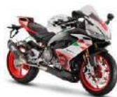
aprilia RS 660 Extrema