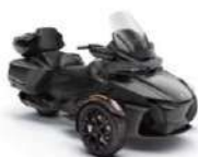
can-am BRP CAN-AM SPYDER RT SEA-TO-SKY