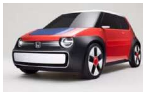
WP SUSTAINA-C Concept