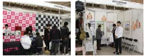
* 前回の様子「クリエイトグループ」(左) / 「自動車事故対策機構」(右)