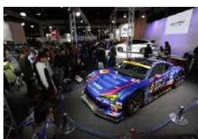
⑧ 福岡モーターショー2019の様子