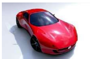
③ 「福岡モビリティショー2023」出展予定車両 MAZDA ICONIC SP (MAZDA)