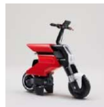
WP Pocket Concept