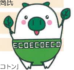
福岡県マスコット キャラクター「エクトン」