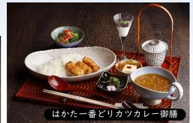
はかた一番どりカツカレー御膳