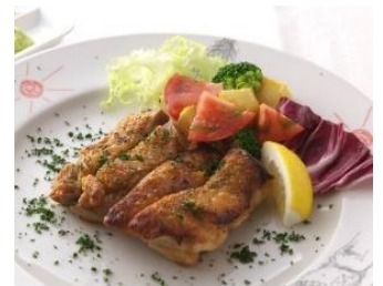
はかた地どりのチキンステーキ

【お問い合わせ先】 株式会社エスエー・エーエスお客様相談室 TEL：03-3376-9009