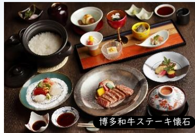
博多和牛ステーキ懐石