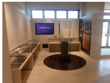
<金印展示コーナー>