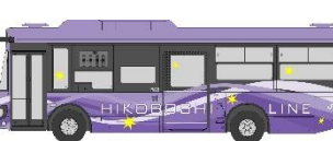
日田市の花「あやめ」カラー