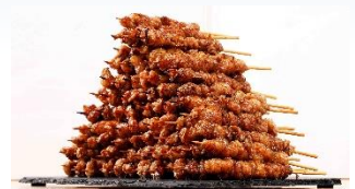
<博多華善・とりかわ>