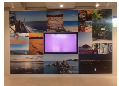
<デジタルサイネージ>