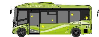
東峰村の「棚田」カラー