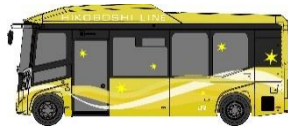
東峰村の特産品「ゆず」カラー