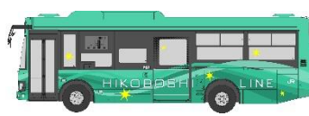
英彦山の「やまなみ」カラー