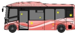
添田町の町花「しゃくなげ」カラー