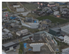
緊急輸送道路の整備