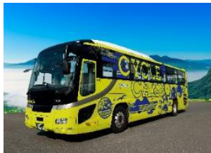
西鉄サイクルバス「サイクルカーゴ」