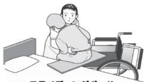
スライディングボード

対象者の体幹をやや前傾した状態で、左右交互に傾けて荷重を片側の臀部にかけ、次に荷重がかかっていない臀部の膝を車椅子背もたれ方向へ押すことで深く座ることができる。滑りにくい座面の場合は、片側のみスライディングシートを座面に敷き、同様に膝を押すことで滑りやすくなり深く座ることができる。