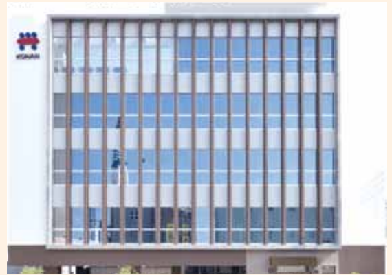
創立40周年を機に移転した本社ビル