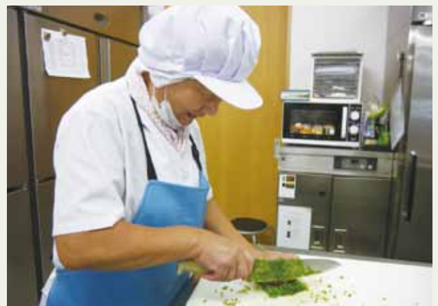
やりがいを持って働く高齢者

また、高齢者が無理なく就労できるよう、ゆとりある作業スペースを確保したり、バリアフリー化を進めるなど、高齢者に優しい職場づくりに努めています。