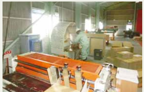
作業しやすい環境で仕事をする様子

その他、毎朝のラジオ体操・転倒防止対応の片足立ち（片足30秒毎）を実施し、高齢者の健康面に配慮した取組を実施している。