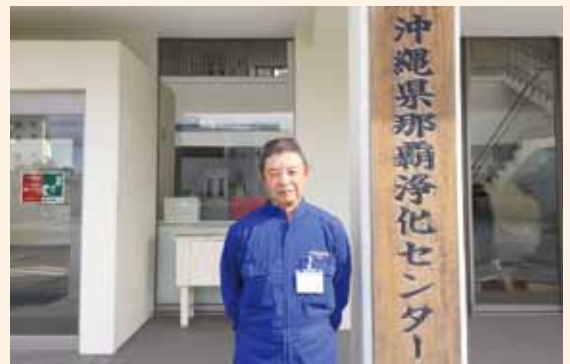
勤続30年目となる砂川さん(66歳)

平成29年に創立40周年を迎えましたが、35年以上の永年勤続者を15名表彰しました。こんなに多数の永年勤続者を出せた事は会社の誇りです。現在300名を超える社員がいますが、全体でのバーベキューパーティ、忘年会、ボウリング大会など集まる機会が多数あります。また他にも月1回、全施設の責任者会議や次課長会議など社員の意見を会社に反映しやすい風土を目指しており、やりがいを持って長く働いてもらえるような会社を目指しています。