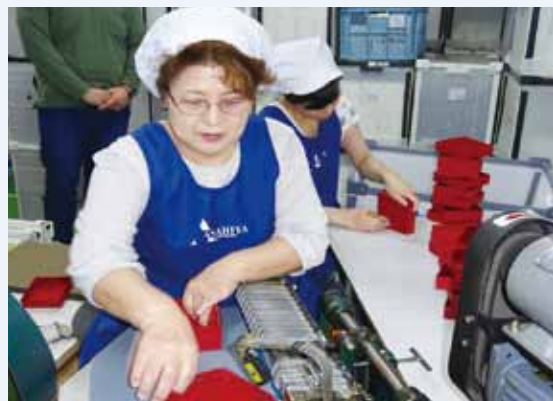
幅広い世代が共に活躍しています

就業形態の自由度は高いです。社員、パート（フルタイム）、パート（短時間）という3つの就業形態に加え、内職スタッフ（請負）の形も導入しながら高齢者の方々に最大限自分に合ったものをお選びいただいています。また、工場や事務所内の安全衛生の充実のために、会社全体で5S活動や安全衛生活動等を積極的に行い、高齢者の方々のみならず全ての方々が働きやすい環境づくりに努めています（5S活動は期末に表彰もあります）。