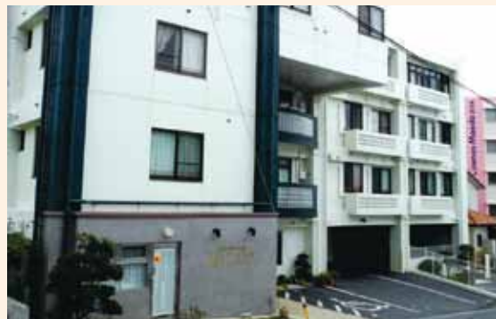
エバーグリーン経塚、経塚デイサービスセンター