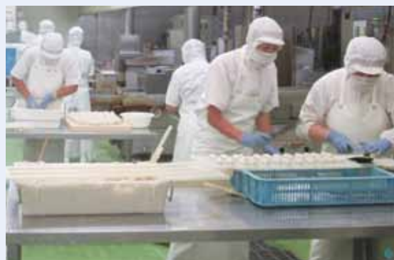
さつま揚げを製造している様子