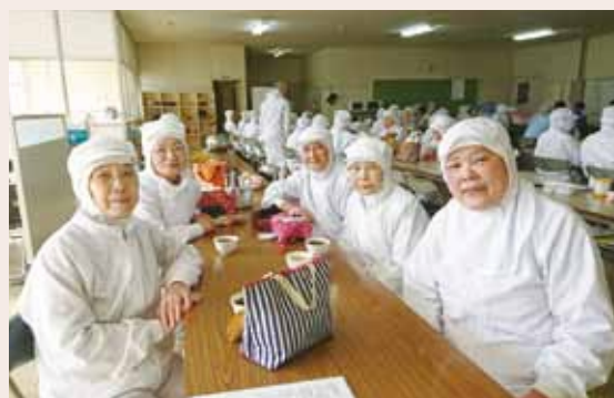
ブロイラー事業部の皆さん

年齢制限は設けておらず、希望等があれば慣れた職場で今までの経験を活かして働き続けることができる環境を整え、71歳の職員が現役で働いています。さらに、食鳥検査等の国家資格を有する職員については、71歳の方であっても、常勤職員と同様に勤務していただいています。