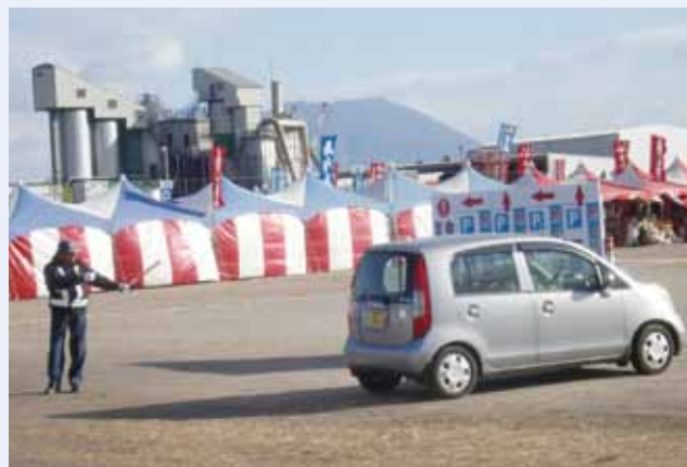
交通誘導をする様子

また、健康管理面においては、年1回人間ドックを受診してもらい、できるだけ従業員が健康で長く働き続けられるように健康状態等を把握し、雇用形態・勤務内容等を決定しています。