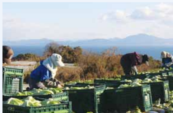
レタスの収穫風景

農業生産法人を設立し、地域の人手の足りない農家に経験豊富な高齢社員を派遣し収穫の支援等をしています。