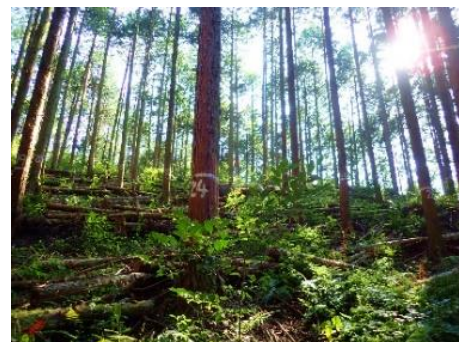
強度間伐 3 年後の森林