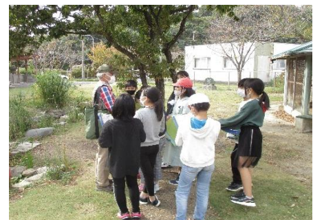
森林環境教育の様子