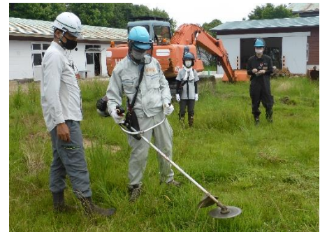
基礎講座（下草刈り）の様子