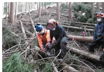
チェーンソー基礎研修