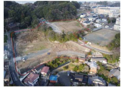
※赤枠は概ねの位置を示しています