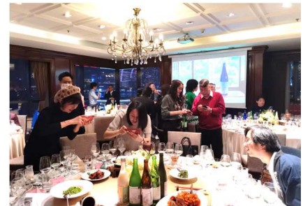
(写真1) ペアリングの様子

0.1%に過ぎない(2019年時点)。中華レストランでワインが浸透しているように、同じ醸造酒で、度数も近い日本酒が中華レストランにも受け入れられる可能性は十分あると考え県産酒の効果的なPR方法を検討した。当事務所が現地のレストラン経営者や日本酒バイヤー等の関係者にヒアリングを実施したところ「日本酒販売量増のためにはペアリングを広く進めることが鍵になる。」といった声が多数の関係者から寄せられた。そこで、当事務所では本年3月に高級中華レストラン経営者らを対象に県産酒販路拡大の取組「中華料理と日本酒のペアリング 4 」を実施(写真1)。参加者らからは「ペアリングがよく考えられていて、お酒の個性に合わせた料理となっていた。予想以上に相性もよくて驚いた」と評価する声が多く寄せられた。当日の様子は共同通信やヤフーニュースなど各種メディアでも取り上げられた。その後も同様の取組を7月までに計4回実施、延べ122名のレストラン経営者らが参加、レストラン5店舗に対し県産酒10銘柄の採用が決まるなど着実に成果が出ている。