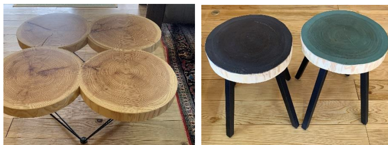
写真左：杉クローバーテーブル 写真右：杉スツール