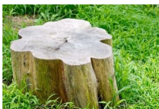
写真左：地際材（イメージ写真）

一年に1本刻まれるもの。春から夏にかけては成長速度が速いため色が薄く、秋から冬は短期成長が鈍化するため色が濃くなります。そのため差がはっきりしていて、1年1年の成長を読み取ることができます。四季がある国でしか年輪は刻まれません。また線の巾や太さにより気候変動なども読み取ることができます。