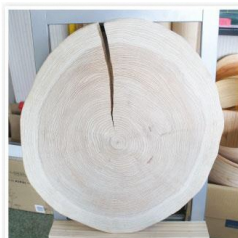
写真右：割れを起している年輪材。