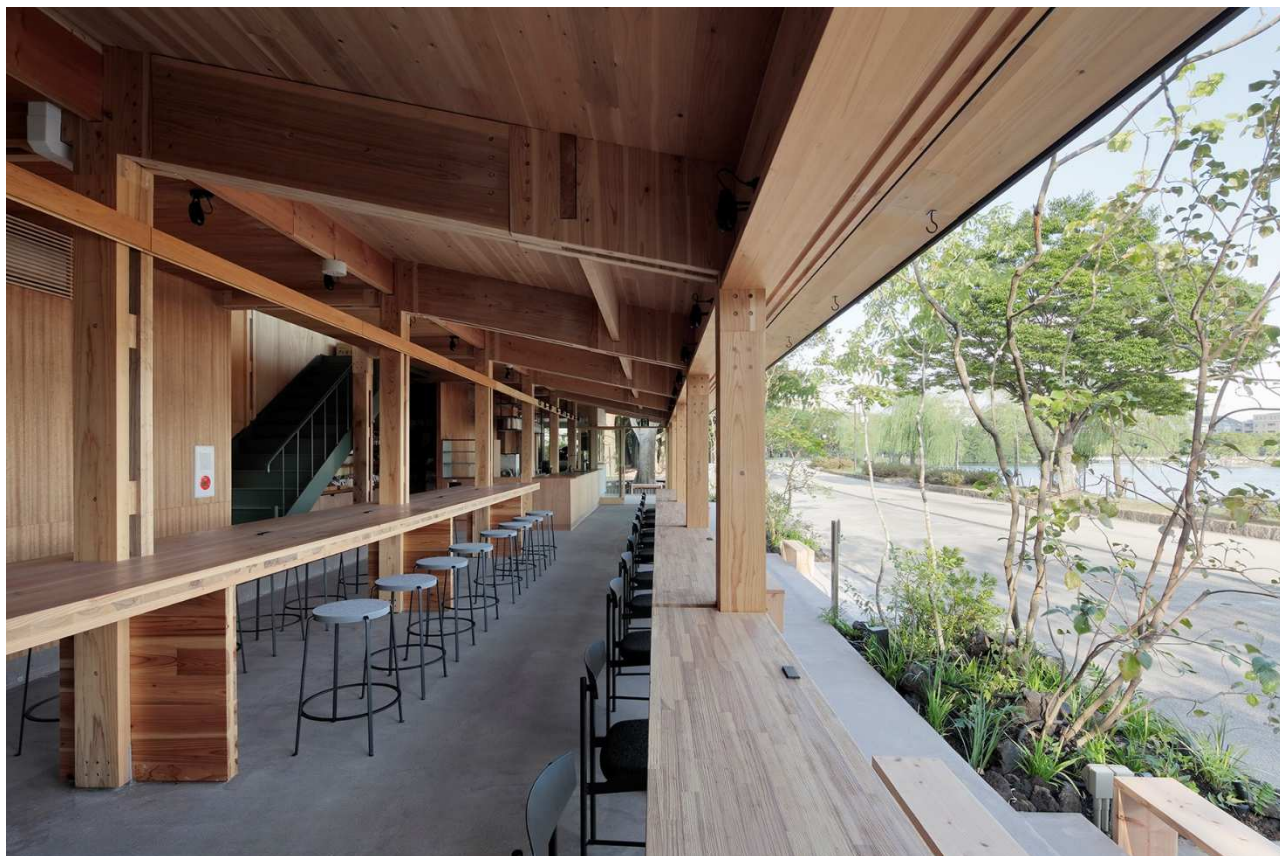
木造の部 大賞 大濠テラス～八女茶と日本庭園と。～