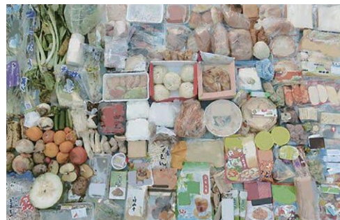
捨てられた手付かずの食品例

食べられるのに捨てられている食品ロスのこと。 日本では、年間600万トン以上の食品ロスが発生しています。 食品ロスの中には、手付かずの状態ですてられている食品もあり、この状況を多くの方に知っていただくことが大切です。