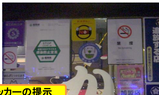
ステッカーの提示