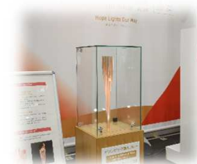
<オリンピックトーチ>