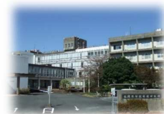
<県保健環境研究所>