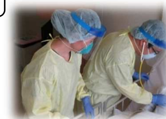
<感染症患者に対応する医療従事者の様子>