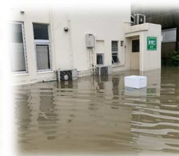
<被災した高齢者福祉施設>