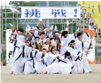
▲玄洋高校 体育大会