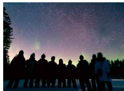
▲鞍手高校 SSHフィンランド研修