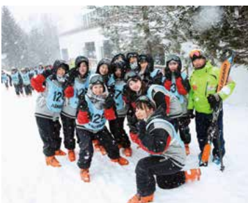
▲浮羽究真館高校 修学旅行