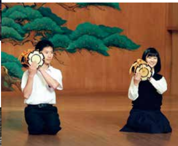
▲筑紫高校 能・狂言体験