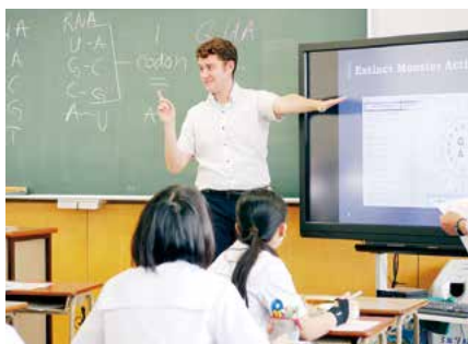
▲宗像高校 イマージョン教育(生物)