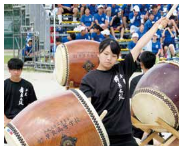
▲早良高校 和太鼓部