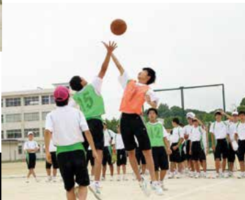
▲春日高校 クラスマッチ