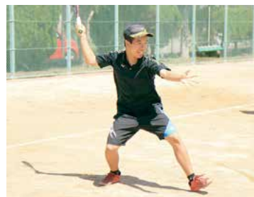
▲筑紫中央高校 ソフトテニス部