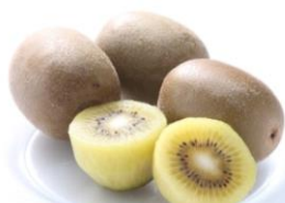
キウイフルーツ「甘うい」