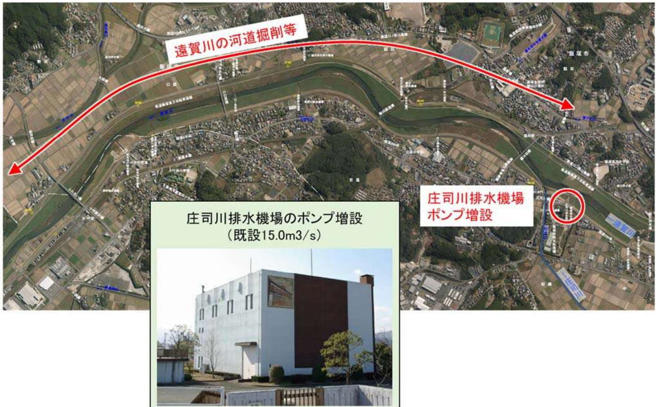
図 3.2.1 国土交通省による事業概要

福岡県の支川整備に伴う流量増などに対応するため、庄司川排水機場のポンプ増設を実施する。また、庄司川合流点の水位低下のため、遠賀川水系河川整備計画に基づき遠賀川本川の河道掘削を行う。