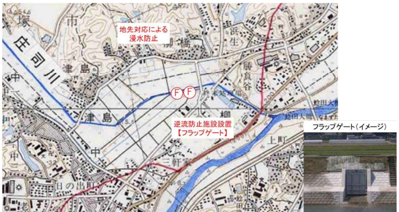
図 3.2.3 飯塚市による事業概要

庄司川からの逆流を防止するため、庄司川に合流する排水路にフラップゲートの設置を行う。また、個別に家屋の浸水防止対策を行う。