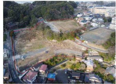
※赤枠は概ねの位置を示しています