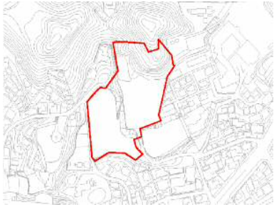
※赤枠は概ねの位置を示しています