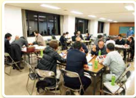
天草夕陽八景プロジェクト・ワークショップの風景

ることが分かりました。今後とも、全国で地域人材を見つけ出し、つなぎ、様々な交流と展開が可能となるようなワークショップの取組が大きく進むことに期待したいと思います。