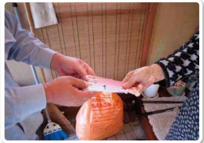
「ありがとう」の気持ち

終了後「ありがとうの気持ち」として、おタスケさんに手渡すという仕組みになっています。