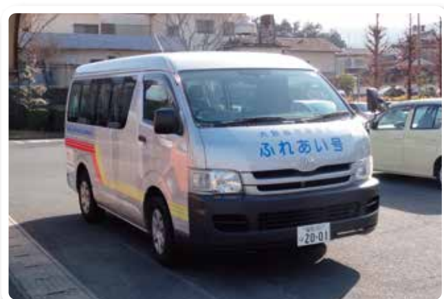
ふれあい号出発です!!

そこで、移動手段として考えられたのが「ふれあい号」です。利用対象を原則65歳以上(身体に障がいのある方、妊婦の方も乗車可)とし、利用者9人乗りの車両で運行。2コースを隔日で回ります。停留所は各区長など地区の意見を基に設置し、利便性を考慮して1コース当たり約40か所あるのも特徴的です。