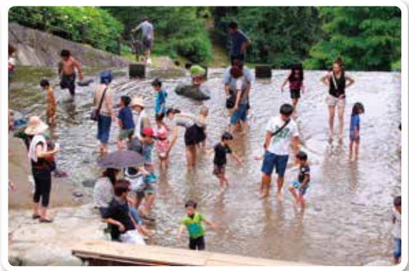
観光客で賑わっています

“地域の宝「白糸の滝」を魅力あるものに”、行政区民の共通理解が、地域のつながりを強くし、地域の活性化へとつながっているのではないのでしょうか。