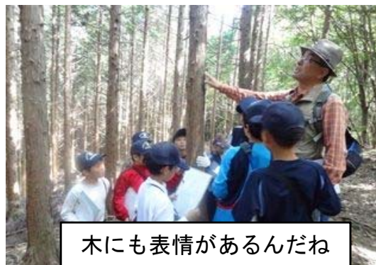
木にも表情があるんだね