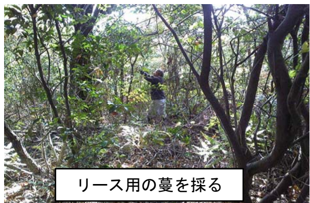
リース用の蔓を採る