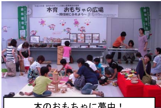
木のおもちゃに夢中！