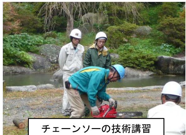
チェーンソーの技術講習