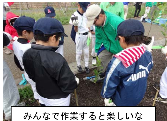
みんなで作業すると楽しいな