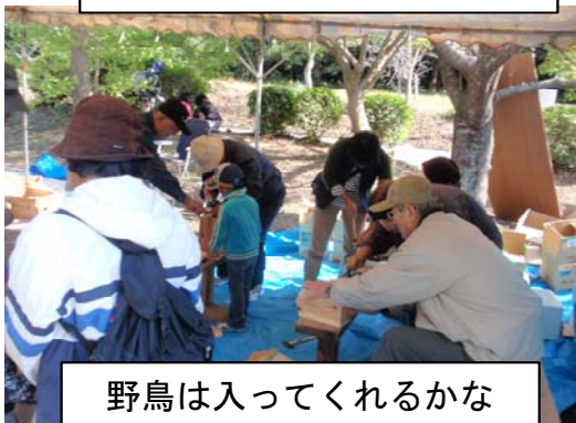
野鳥は入ってくれるかな