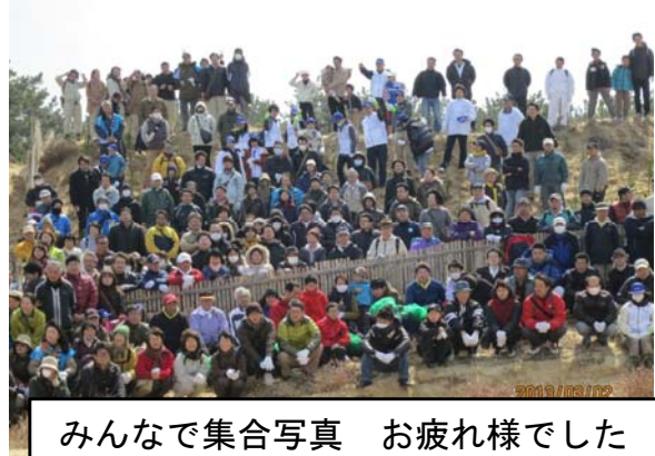
みんなで集合写真 お疲れ様でした