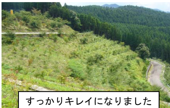
すっかりキレイになりました