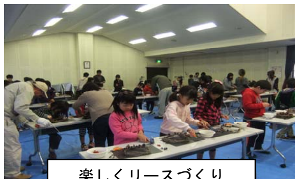
楽しくリースづくり