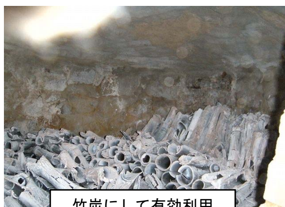
竹炭にして有効利用