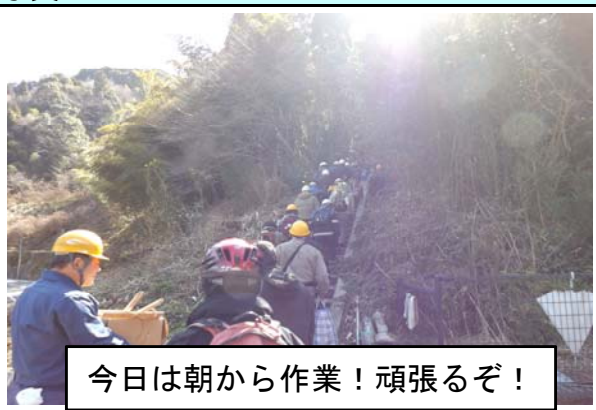
今日は朝から作業！頑張るぞ！