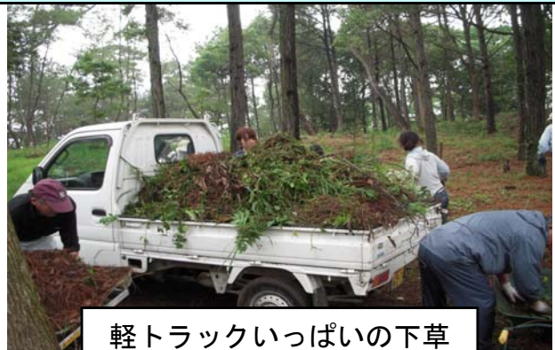
軽トラックいっぱいの下草