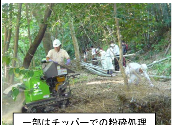
一部はチップーでの粉碎処理