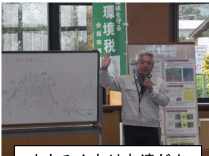
山とみんなは友達だよ