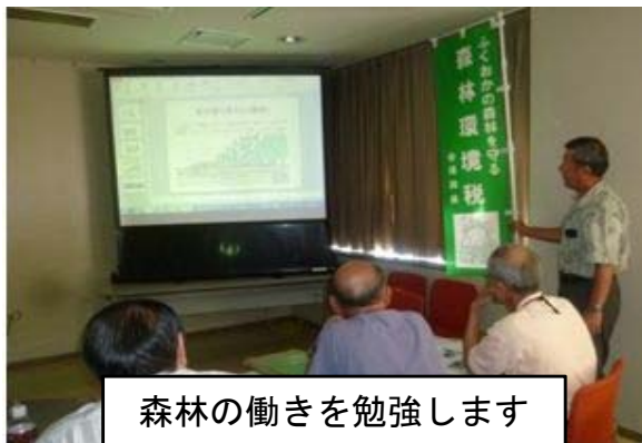
森林の働きを勉強します