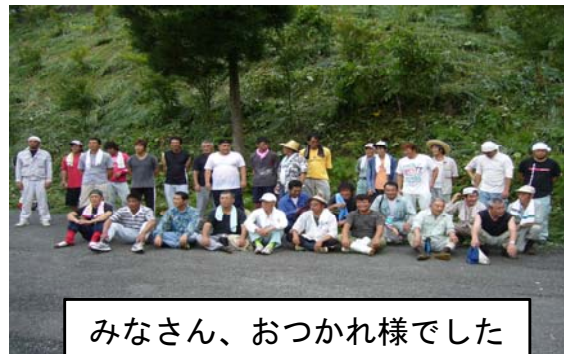
みなさん、おつかれ様でした