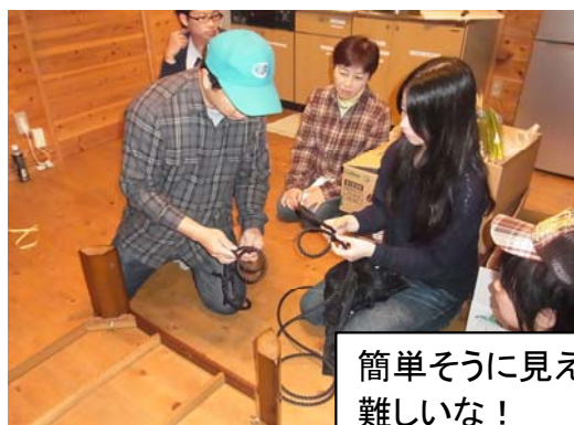
簡単そうに見えて、ロープワークは難しいな！