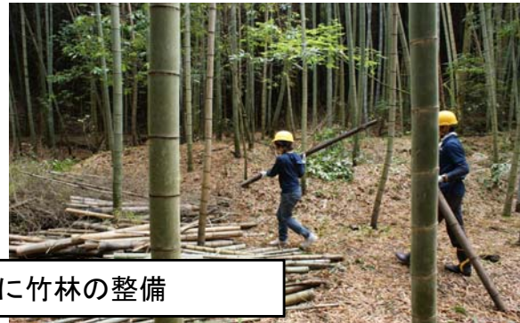
大学生を中心に竹林の整備