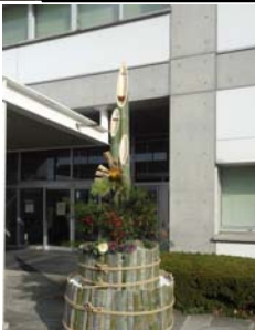
間伐した竹でつくった門松