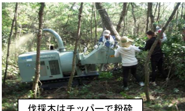
伐採木はチップパーで粉碎