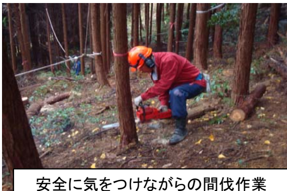
安全に気をつけながらの間伐作業