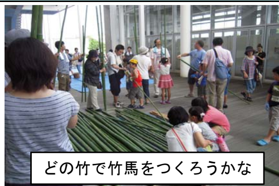
どの竹で竹馬をつくろうかな