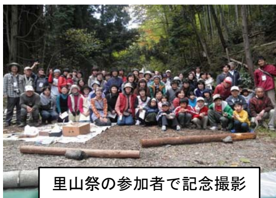
里山祭の参加者で記念撮影