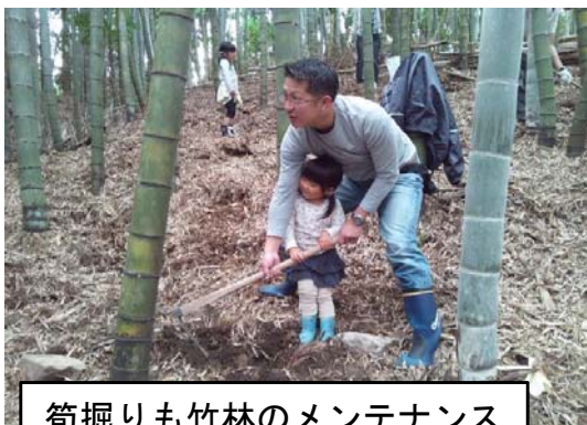
筍掘りも竹林のメンテナンス