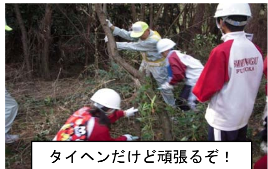
タイヘンだけど頑張るぞ！