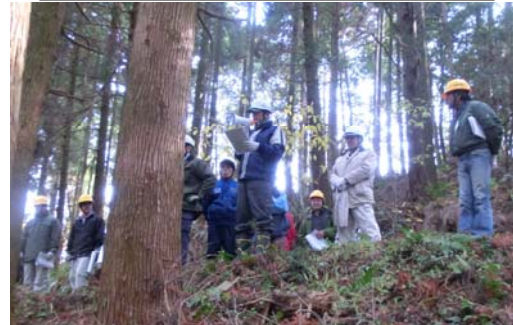
間伐する木の選び方も重要です