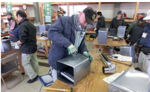
災害時にも役立つロケットストーブ