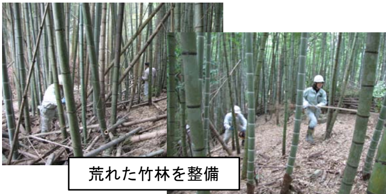
荒れた竹林を整備