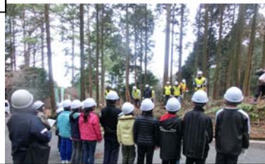
山の大切さ！分かったかな