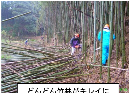
どんどん竹林がキレイに