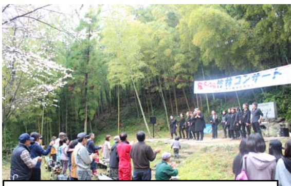
竹林でのコンサートにうっとり