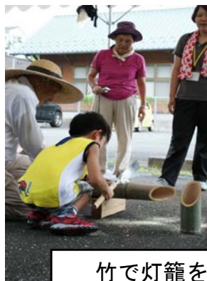
竹で灯籠を作りました