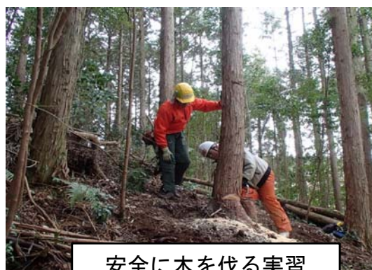
安全に木を伐る実習