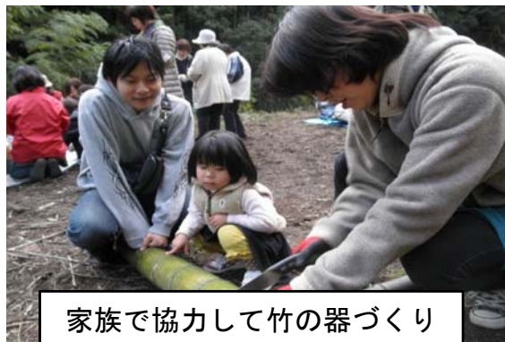
家族で協力して竹の器づくり