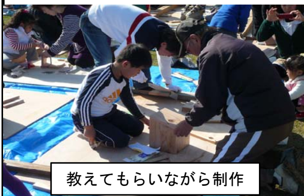
教えてもらいながら制作