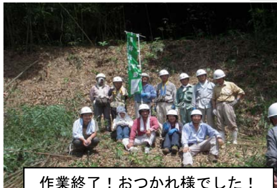
作業終了！おつかれ様でした！