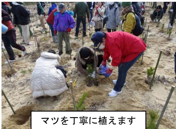
マツを丁寧に植えます