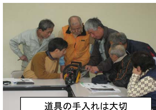
道具の手入れは大切