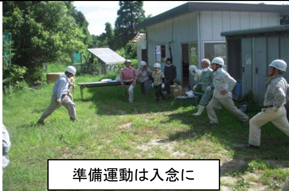
準備運動は入念に