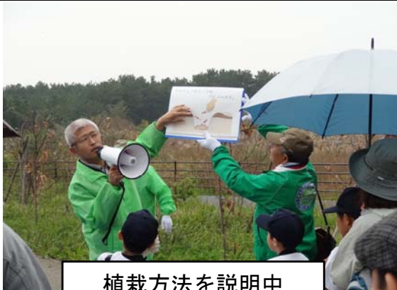
植栽方法を説明中