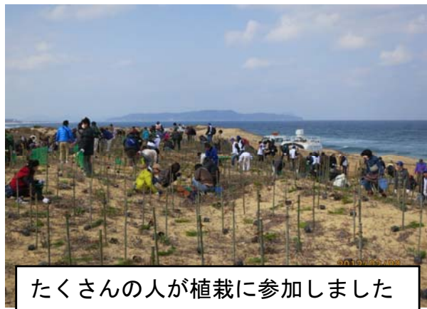
たくさんの方が植栽に参加しました