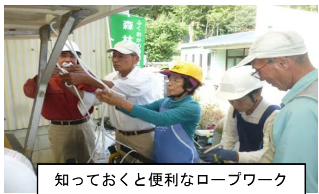
知っておくと便利なロープワーク