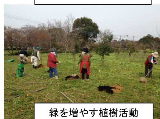
緑を増やす植樹活動