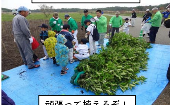
頑張って植えるぞ!