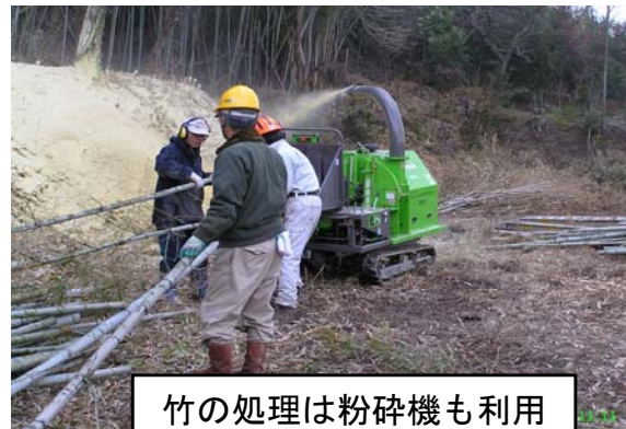
竹の処理は粉碎機も利用