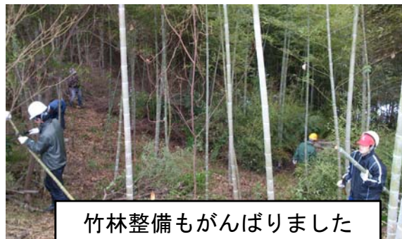
竹林整備もがんばりました