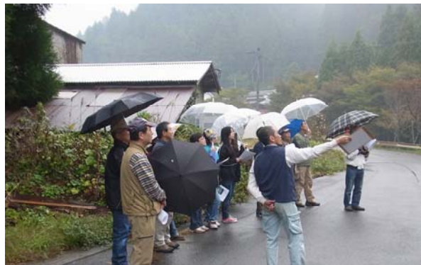
シカの食害について考える