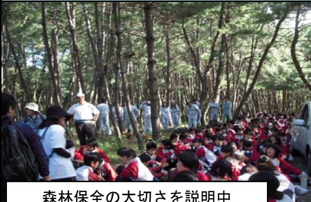
森林保全の大切さを説明中