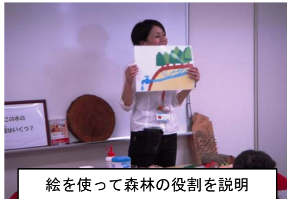
絵を使って森林の役割を説明