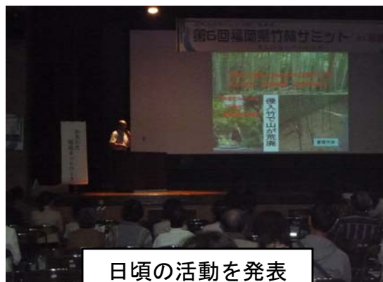
日頃の活動を発表