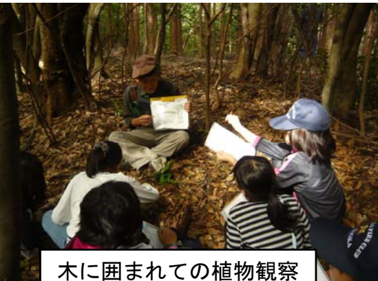
木に囲まれての植物観察