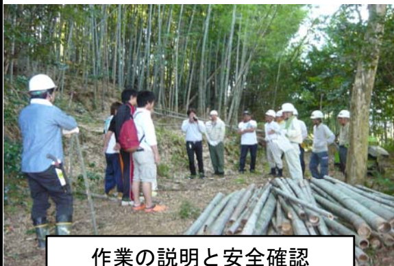
作業の説明と安全確認