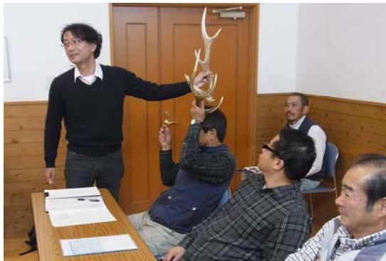
シカの生態についてみんなで学習