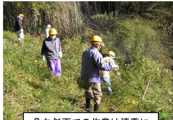
急な斜面での作業は慎重に