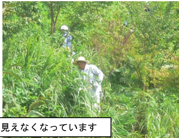
植栽した木が、雑草で見えなくなっています