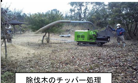
除伐木のチップパー処理