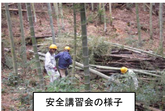
安全講習会の様子