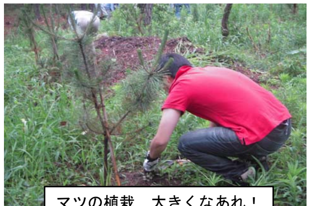
マツの植栽 大きくなあれ！