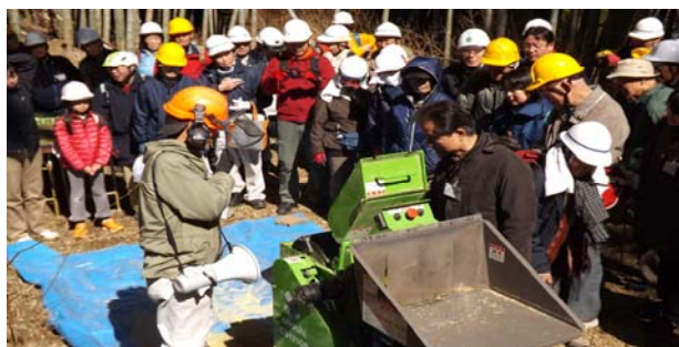
パウダーにすると活用方法が広がることを知りました