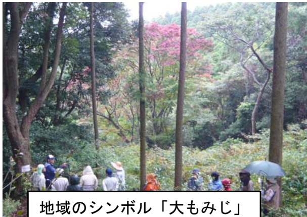
地域のシンボル「大もみじ」