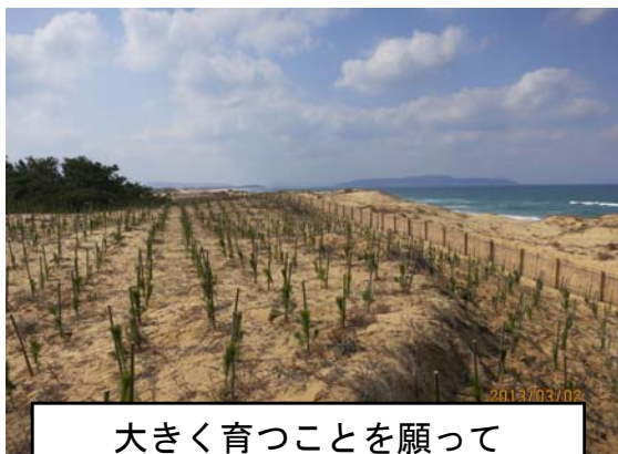
大きく育つことを願って