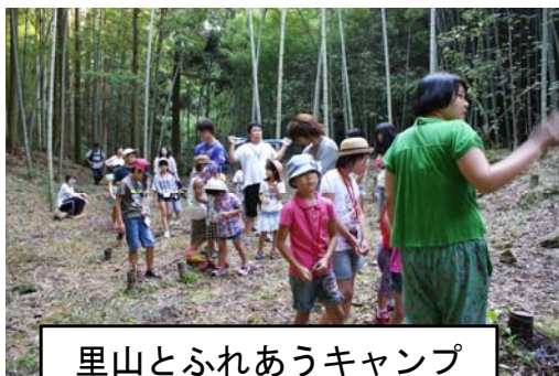
里山とふれあうキャンプ