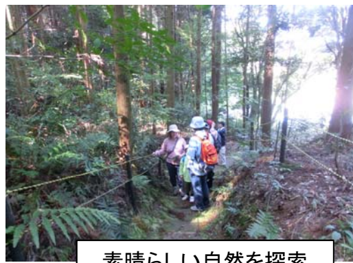
素晴らしい自然を探索