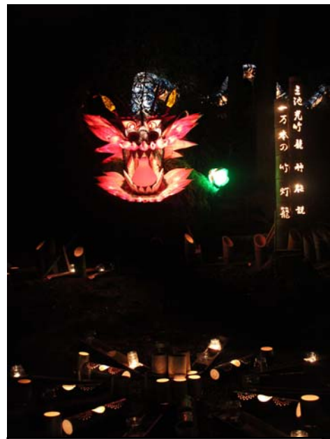
すごい！竹灯籠で龍神伝説