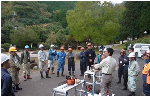
大事なものはチェーンソーの手入れ