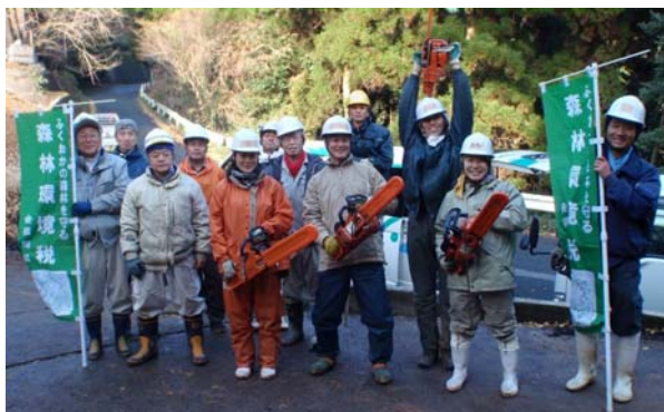
覚えた技術は今後の森林づくりに活かします！