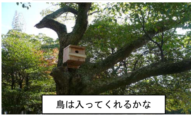
鳥は入ってくれるかな