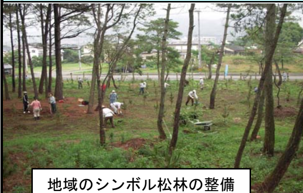
地域のシンボル松林の整備