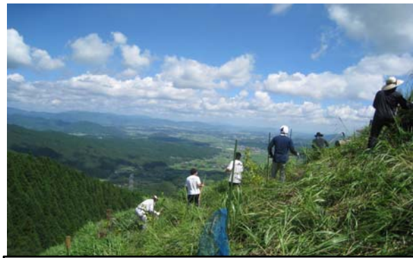
森林がキレイになって気分も清々しい