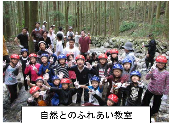
自然とのふれあい教室