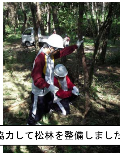
協力して松林を整備しました