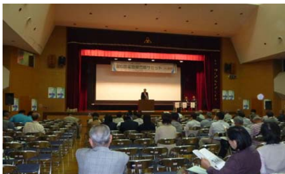
森林の現状と課題についての講演