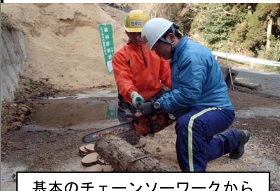
基本のチェーンソーワークから