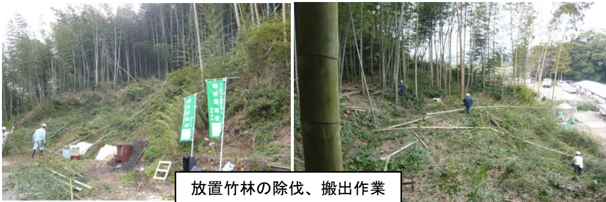
放置竹林の除伐、搬出作業