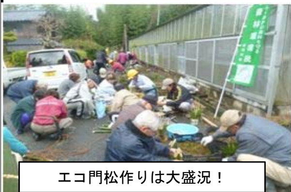
エコ門松作りは大盛況！