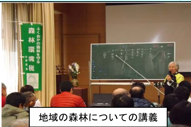
地域の森林についての講義