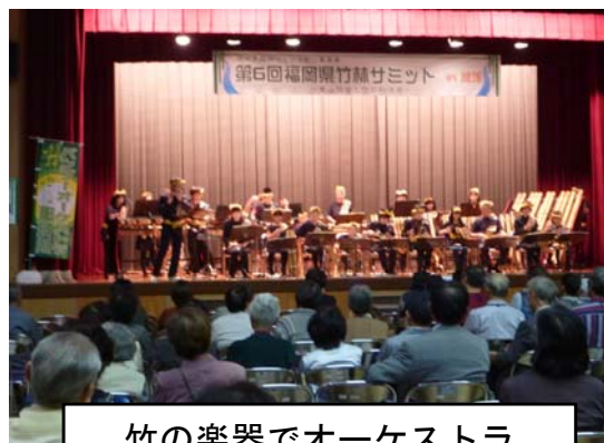
竹の楽器でオーケストラ