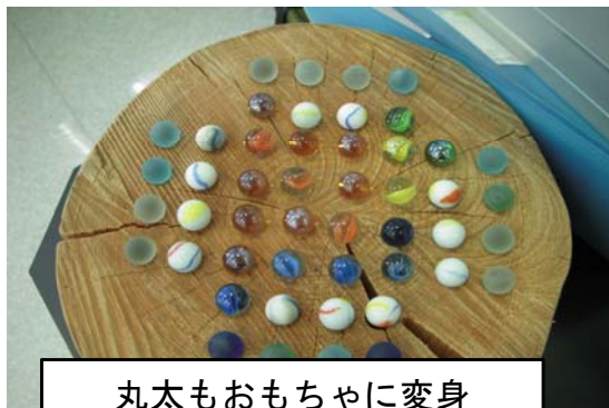
丸太もおもちゃに変身