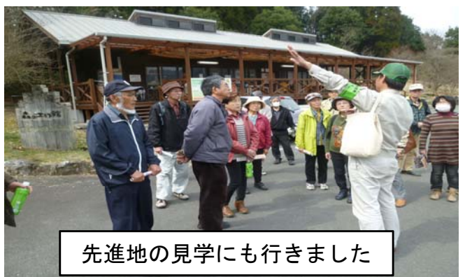
先進地の見学にも行きました