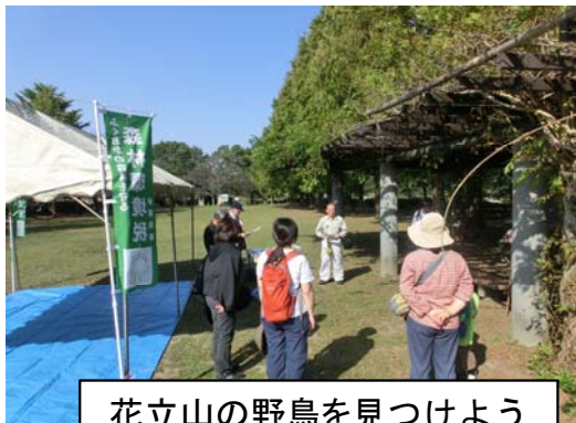
花立山の野鳥を見つけよう