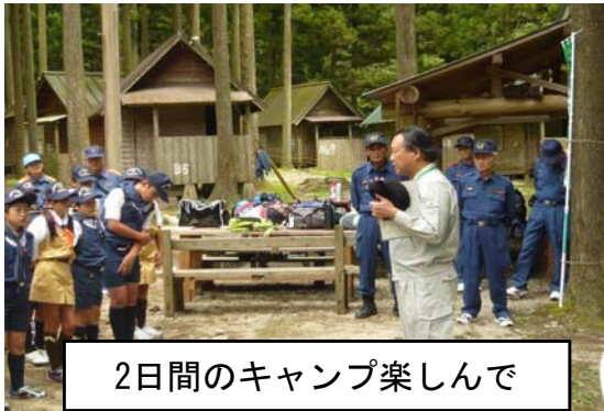
2日間のキャンプ楽しんで