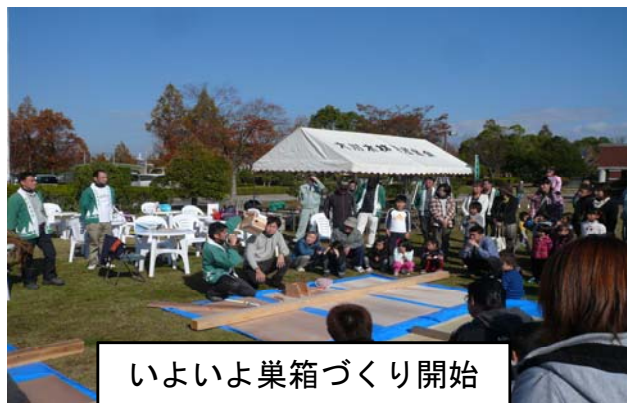
いよいよ巣箱づくり開始