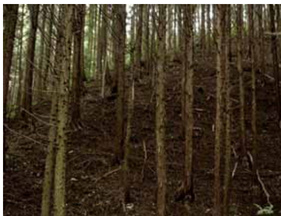
( 施行前 )