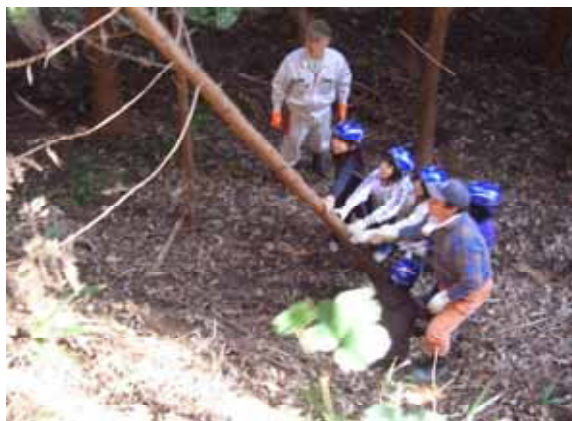
小学生と一緒に 行う間伐 (嘉麻市)