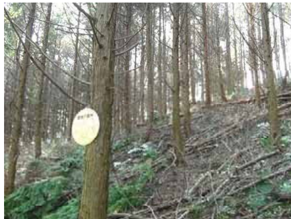
( 間伐実施後 )