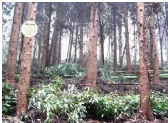
( 竹の伐採後 )