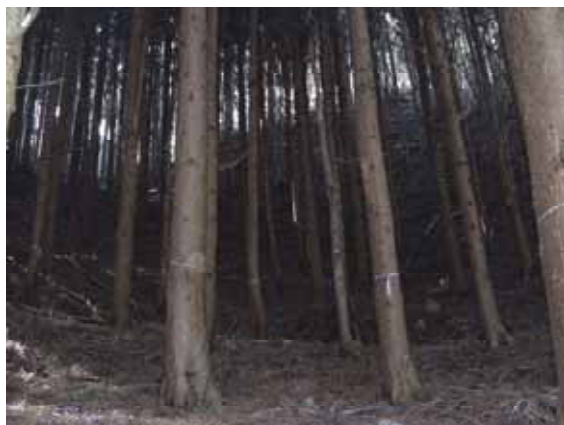
( 施行前 )