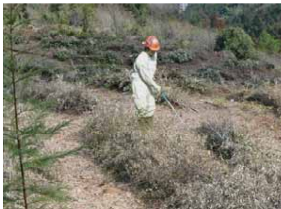
(植栽前の雑草整理等の作業中)