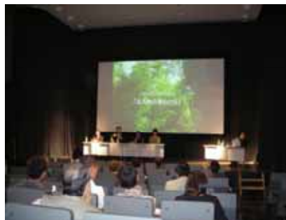
森林をテーマにした シンポジウム (北九州市)