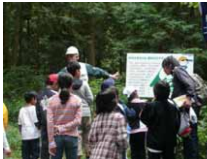
小学生を対象にした 自然学習会 (久留米市)