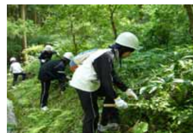
ボランティアによる森林の整備(下草刈り)