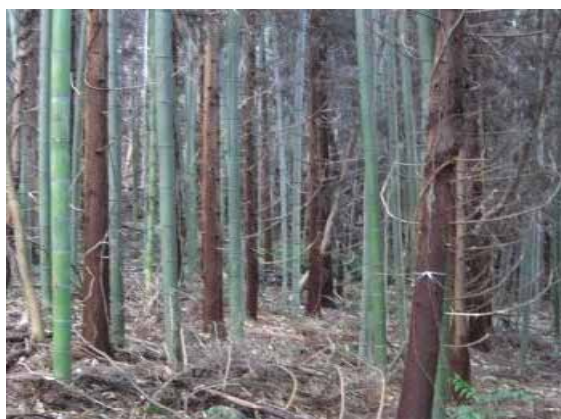
( 施行前 )