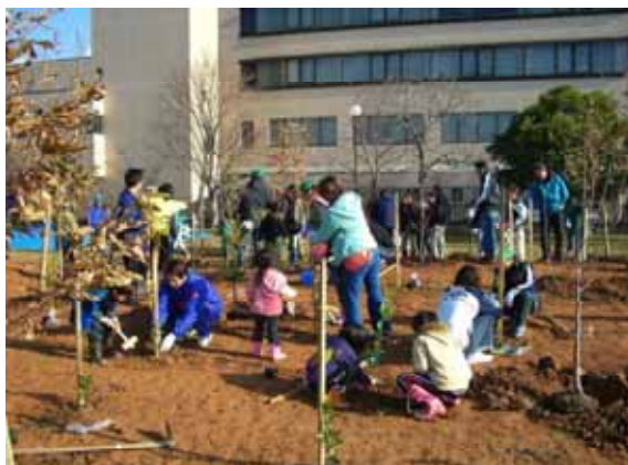
住民参加による 新たな森づくり (大川市)