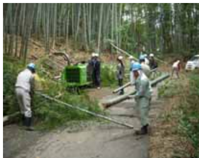
地域住民による 竹林整備 (篠栗町)