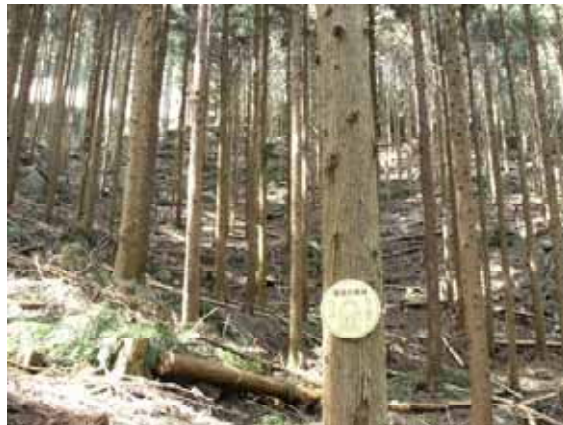
( 間伐実施後 )