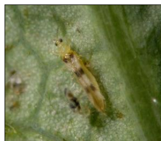
◆ ハダニアザミウマ