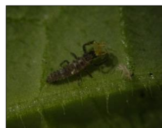
◆ テントウムシ類幼虫