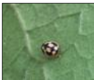
◇◆ ヒメメノコテントウ