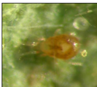
◆◇ ミヤコカブリダニ