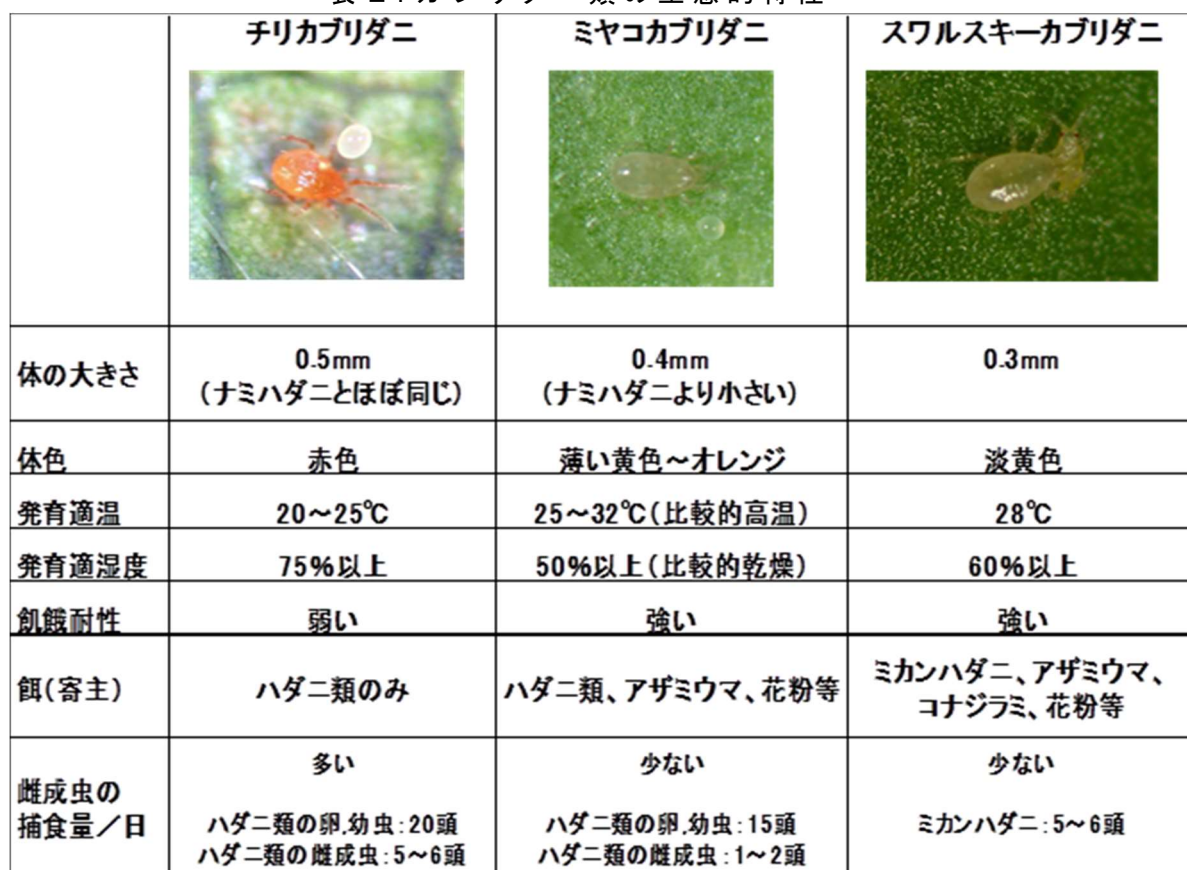
表2.カブリダニ類の生態的特性

無加温、厳冬期等の天敵が活動できない時期の使用は避ける。 容器中での生存日数は短いので、入手後速やかに使い切る。