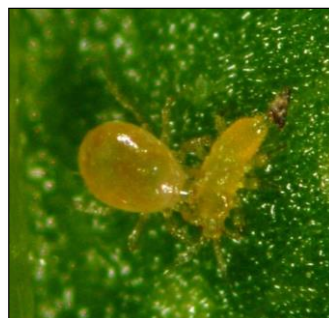
◇ スワルスキーカブリダニ