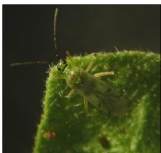
◆ タバコカスミカメ