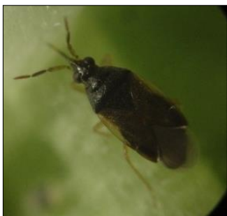
◆◇ ヒメハナカムシ類