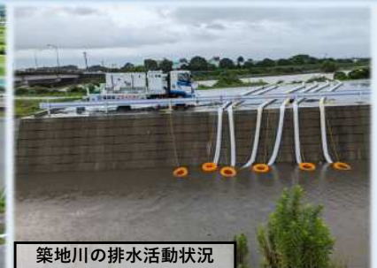
築地川の排水活動状況