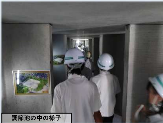
調節池の中の様子