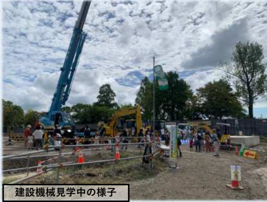
建設機械見学中的様子

現在、『金丸川・池町川 浸水対策重点地域緊急事業』の一環で地下調節池の工事を進めています。そこで今回、地域にお住まいの皆さんと江南中学校2年生に工事現場を開放して、現場見学会&防災教育を実施し、普段は入ることができない地下調節池を見ていただきました。多くの方に参加いただき、人知れず地域を守っている防災インフラの必要性や実施中の工事への理解と協力を呼びかけることができました。