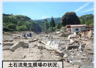
土石流発生現場の状況