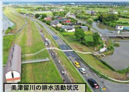
美津留川の排水活動状況