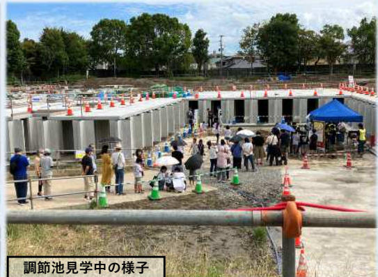
調節池見学中的様子

~皆様のご意見をお聞かせください~ 久留米県土整備事務所 企画班 TEL:0942-44-5344 E-mail:kurume-ld@pref.fukuoka.lg.jp HP:https://www.pref.fukuoka.lg.jp/soshiki/4803202/