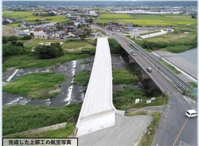
完成した上部工の航空写真

長野橋は昭和36年に架設された橋梁であり、老朽化のため劣化が著しく進行しており、また、橋脚が多く、河積を阻害しているため、平成30年度から架換工事を行っています。令和5年10月に上部工の架設が終わり、現在前後の道路改良を予定しております。地元の方々のご協力を得ながら、早期の供用開始を目指しています。