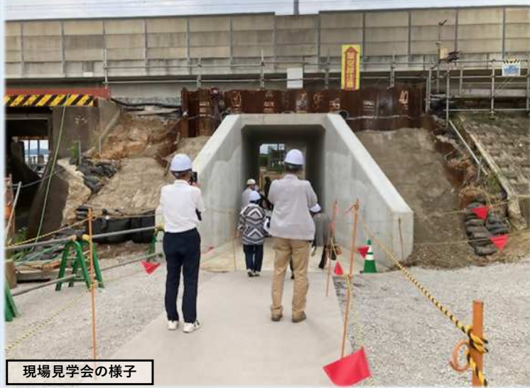
現場見学会の様子

JR鹿見島本線下のアンダーパス「西牟田高架下」は通学路であるにも関わらず、歩道が無く道路幅員も狭いことから、歩行者の安全を図ることを目的に歩道設置事業を進めています。このたび、JR下の推進工事が貫通したため、令和5年6月に地元関係者に対し現場見学会を実施しました。今後も地元の方々のご協力を得ながら、早期完成を目指して行きます。