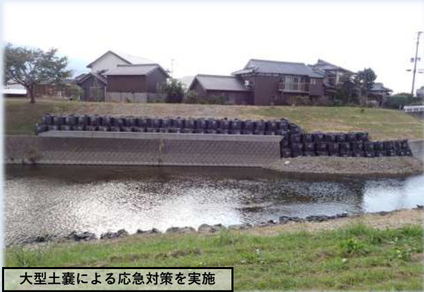
大型土嚢による応急対策を実施

令和5年7月10日の豪雨により、管内河川の各所で、護岸が崩壊するなどの多くの被害を受けました。久留米県土整備事務所では、被災時から緊急対応をおこなうと共に、次の雨に備えて、応急工事を実施しました。現在は、早期復旧に向けた取り組みを進めており、順次、復旧工事に着手していきます。