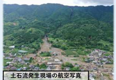
土石流発生現場の航空写真

7月7日から10日の豪雨により、久留米市田主丸町の千之尾川で土石流が発生し、竹野地区で甚大な被害をもたらしました。福岡県では千之尾川の土石流対策として、国土交通省に災害関連緊急砂防事業を申請し、アンカーネット式構造物の設置や砂防堰堤の整備が採択されました。今回の豪雨による土石流被害により、他にも3渓流で災害関連緊急砂防事業が採択されています。現在、4渓流とも早期に工事着手できるよう取組を進めています。