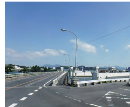
主要地方道 直方芦屋線（西祇園橋） （芦屋町）