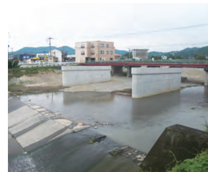
主要地方道 八女香春線（今川橋） （うきは市）