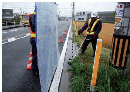
安全な通行を妨げている雑草の草刈