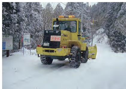
積雪時の雪氷対策