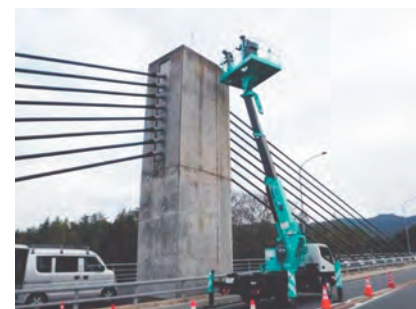
高所作業車による橋梁定期点検の状況