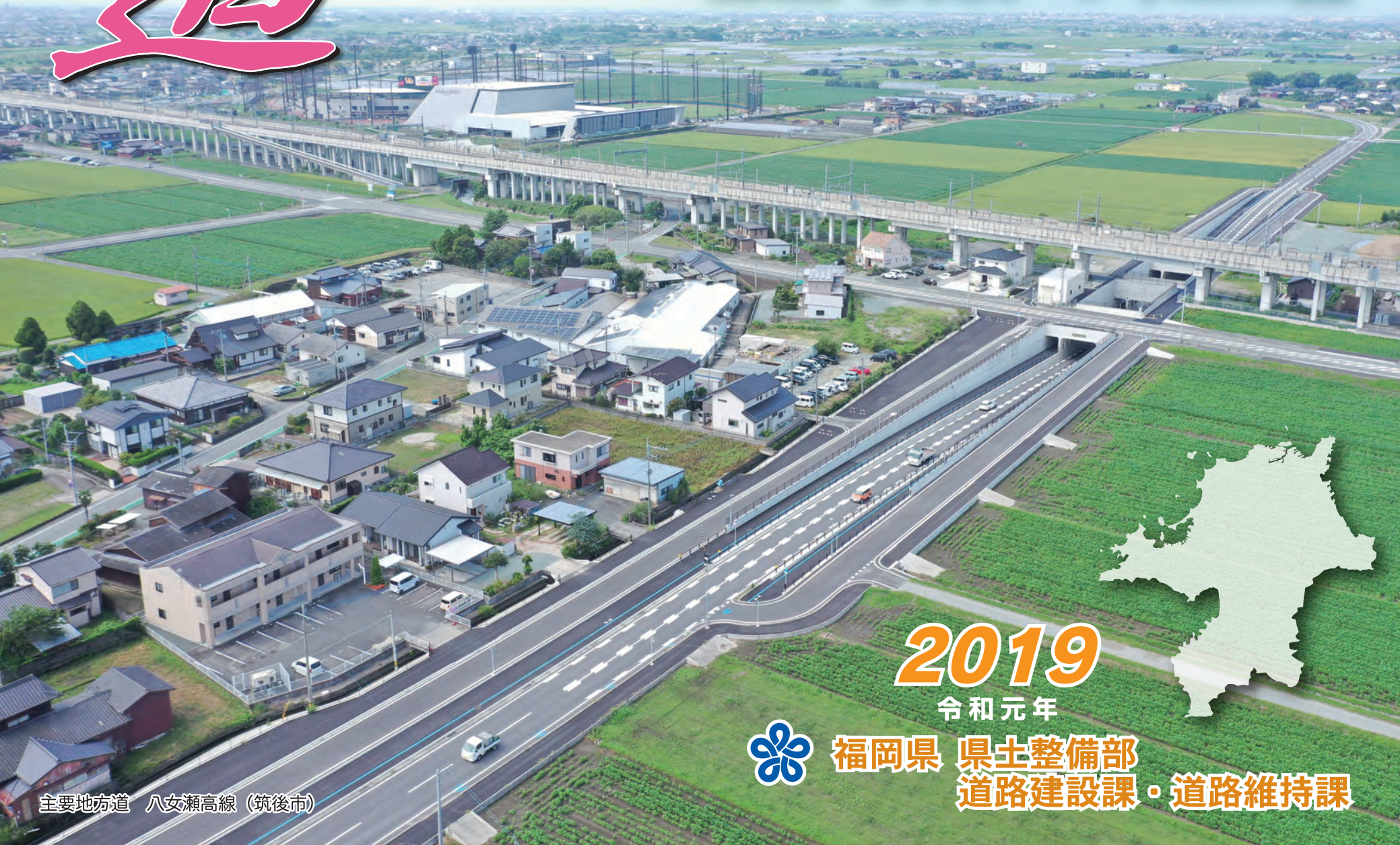
主要地方道 八女瀬高線 (筑後市)