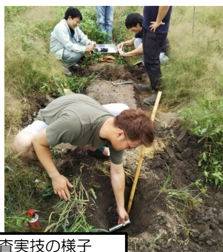
土壌物理性の調査実技の様子