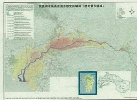
④避難に関する情報