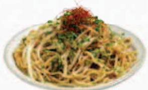
太麺の歯ごたえと香りが際立つ スタミナ(メ)まぜ麺 コチネレ ☎092-716-6855 福岡市中央区春吉3-22-8