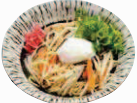
元氣な卵とネギたっぷりの (メ)焼きラーメン 竹乃屋 ☎092-433-5870