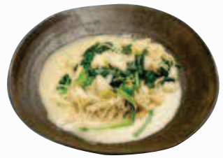
ずわい蟹たっぷりの (メ)オイルヌードル どういち 藤一 ☎050-3314-1084 福岡市東区香椎駅前1-14-32