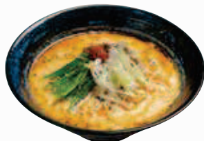
濃厚スープがクセになる 辛コク(メ)担々麺 いちろ 博多一口肉餃子 一口 ☎092-432-8838