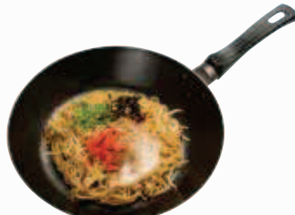
鉄板で仕上げる (メ)焼きラーメン うのはな 優乃華 ☎092-436-7533