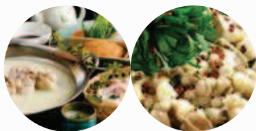
水炊き・もつ鍋を味わい尽くす 鍋の(メ)麺 夢花げんき堂 ☎092-472-2033