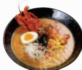
海老・えび・エビの (メ)ラーメン マリンワールドレストラン レイリー ☎092-603-2030 福岡市東区西戸崎18-28 (マリンワールド内)