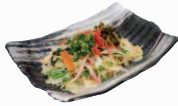
博多屋台の (メ)焼きラーメン アジアン磯貝じゃこくじら ☎050-3466-6046 福岡市博多区博多駅前1-17-6