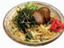
豚の角煮のせ博多名物 (メ)焼きラーメン 天神じゃんぼ ☎092-791-1794 福岡市中央区天神1-12-3 天神町木村家ビル3F