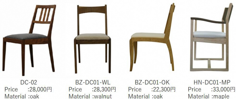
図. (株)辻製作所のダイニングチェアの主力製品（一例）

当社では、主に無垢材を用いたダイニングテーブル、ダイニングチェア等の脚物家具を主力製品として製造している。製品は「適度にシンプルな形状」、「無垢材の素材感が感じられる」、「テーブルサイズや椅子張地のオーダーが可能」等の共通した特徴がある。本事業では、日本の住環境にマッチし、シンプルな形状と適度なサイズを有した上で、現行商品群に「クラシック」、「エレガント」といったテイストを採り入れ、デザインの方向性を少しだけ変化させた新しい商品を開発したい。既存の主力製品と本事業で新たに開発を目指す製品の関係を下図に示す。