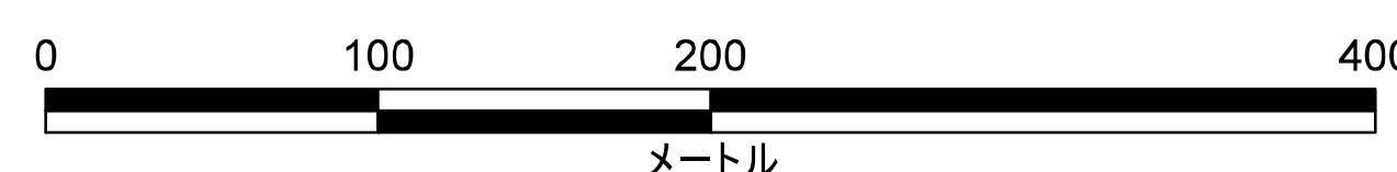
津波災害警戒区域 区域図

この地図の作成に当たっては、国土地理院長の承認を得て、同院発行の数値地図(国土基本情報)電子国土基本図(地図情報)を使用した。(承認番号 平29情使、第1125号)