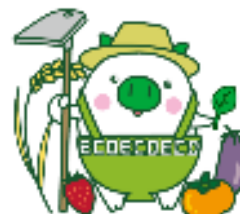
福岡県マスコットキャラクター