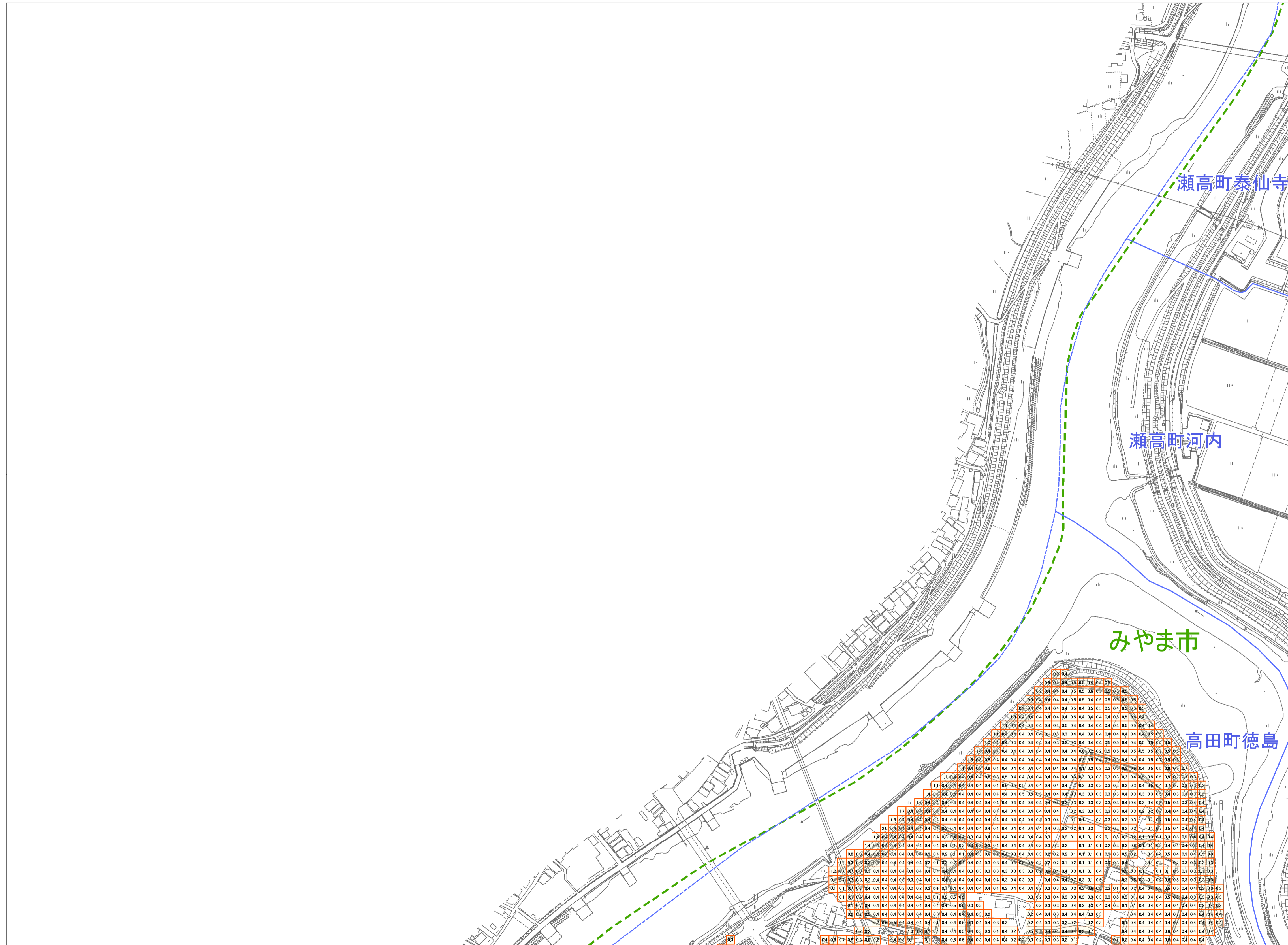
この地図は、みやま市長の承認を得て、同町所管の測量成果を複製して作成したものである。