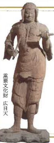
重要文化財 広目天