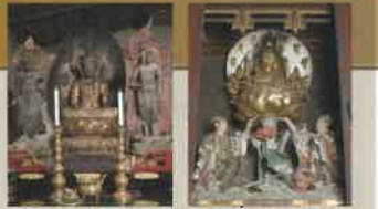
太宰府天満宮本地仏 准謁観世音