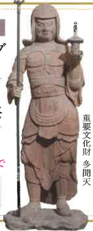
重要文化財 多間天