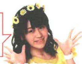
ありさ演歌ショー