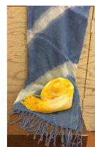
ストール（染物体験） イメージ

地域の魅力を再発見する都市農村交流バスツアー企画。 今回の企画は、福岡県糸島市志摩初エリアを訪ねます！ クラフト体験や未来の福祉機器体験など盛りだくさんの 内容は、地域住民で企画したものです！志摩初エリアの 魅力を体験していただけるバスツアーです！