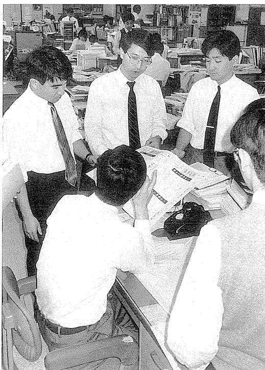
1 解散前日の事務打合せ