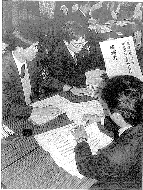
3 立候補受付リハーサル