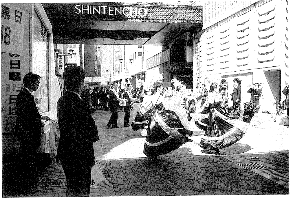
5 街頭啓発（福岡市中央区天神）