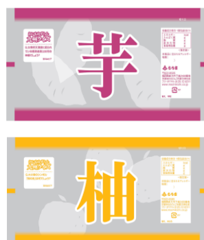
パッケージデザイン(中袋) 袋には九州のご当地クイズを記載