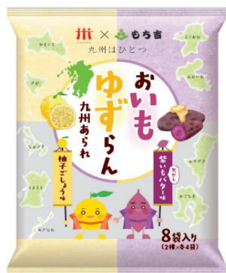
パッケージデザイン(表)

また、商品考案に参加した植木中学校の生徒が、2 月 9 日(金)に古賀 SA(上下線)で商品の PR 活動を行います。