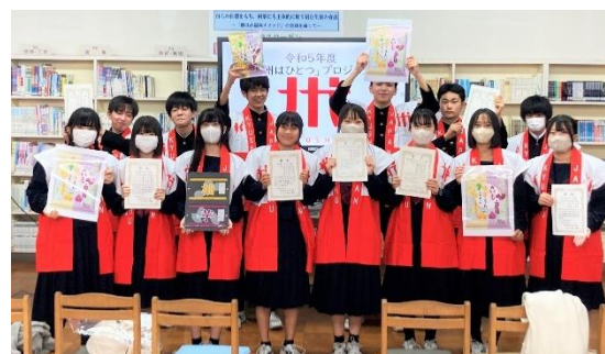
商品考案に参加いただいた 植木中学校の生徒