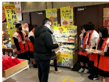
前回の実施イメージ