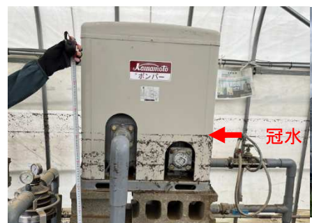
冠水した農業用機械（ポンプ）