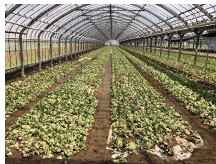
冠水した農作物（サラダ菜）