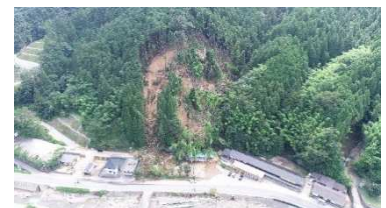
▲被災した林地(山腹崩壊)