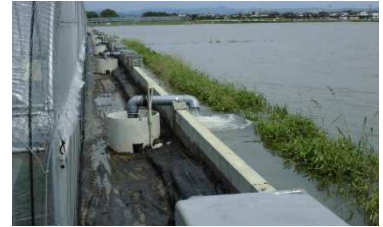
▲災害回避設備 (浸水防止壁、排水ポンプ)